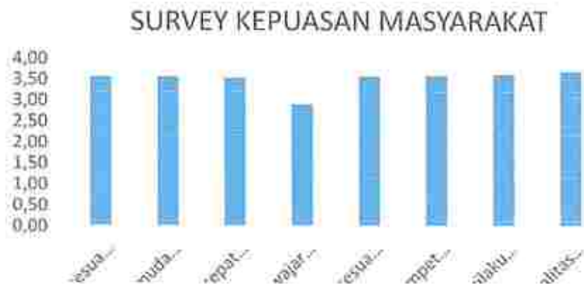
GRAFIK 3.1 NILAI RATA-RATA UNSUR PELAYANAN PADA UNIT PELAYANAN PENGADILAN AGAMA MAROS

Berdasarkan Tabel 3.3 dan Grafik 3.1 menunjukkan bahwa dari 9 unsur pelayanan sudah baik, 8 unsur pelayanan memiliki kualitas yang sangat baik; tetapi masih terdapat 1 unsur pelayanan yang masih kurang baik. Unsur pelayanan yang dinilai masyarakat memiliki kualitas sangat baik dengan nilai paling tinggi adalah unsur Penanganan pengaduan pengguna layanan