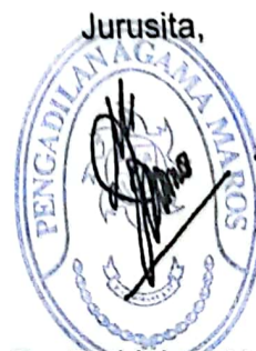
Jurusita, Fachrul Islam Yusuf